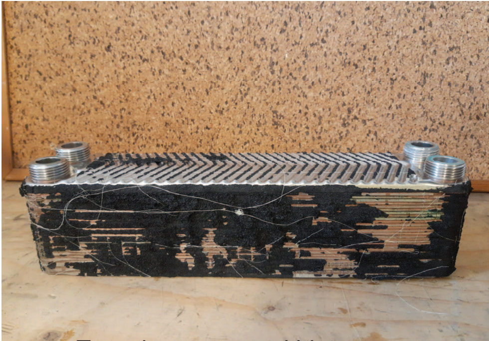
Tauscher vorne und hinten